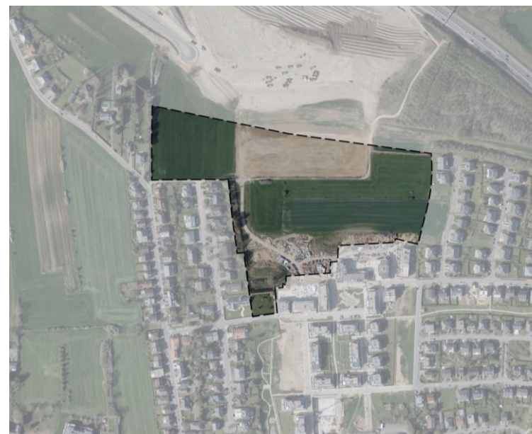
Abb. 2 : Einbindung des Planungsgebietes (Orthophoto)