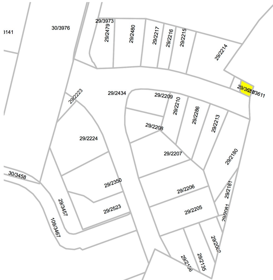
Abb. I.4.2 : Öffentliche Bauträger und Gebietskörperschaften

Die «Société Nationale des Habitations à Bon Marché» (SNHBM) besitzt derzeit in Strassen keine Flächen.