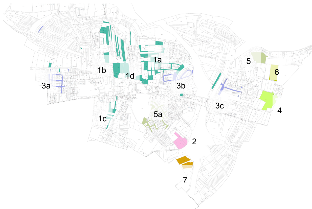
Abb. I.4.5 : Private Bauträger