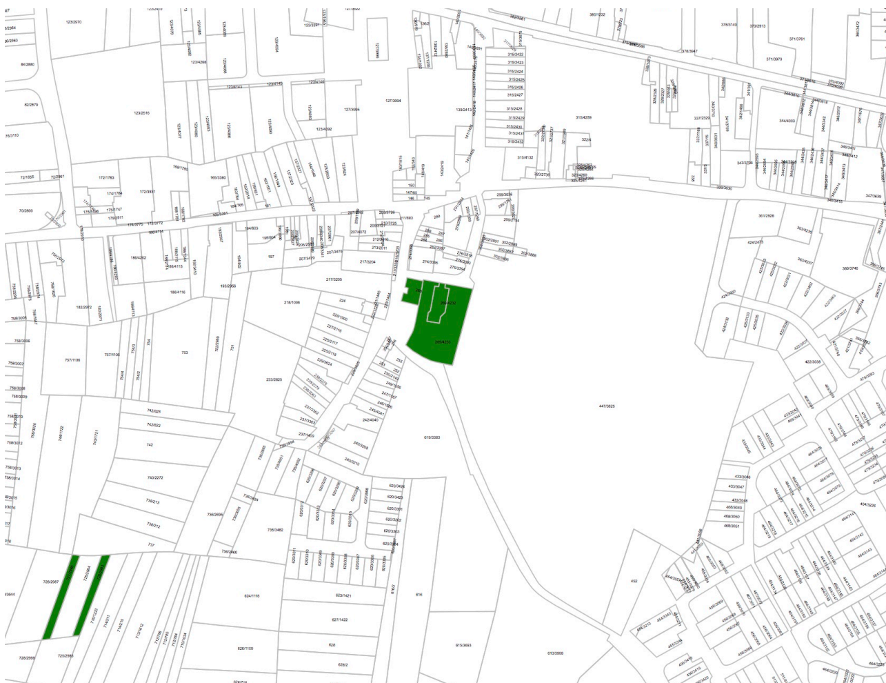
Abb. I.4.4 : Kirche

Die Kirche besitzt in Strassen Grundstücke im Bereich des Ortskern auf denen das Kirchengebäude, das Pfarrhaus und Teile des Friedhofes liegen (im Plan grün markiert). Die Gesamtfläche dieser Parzellen beträgt knapp 0,5 ha.