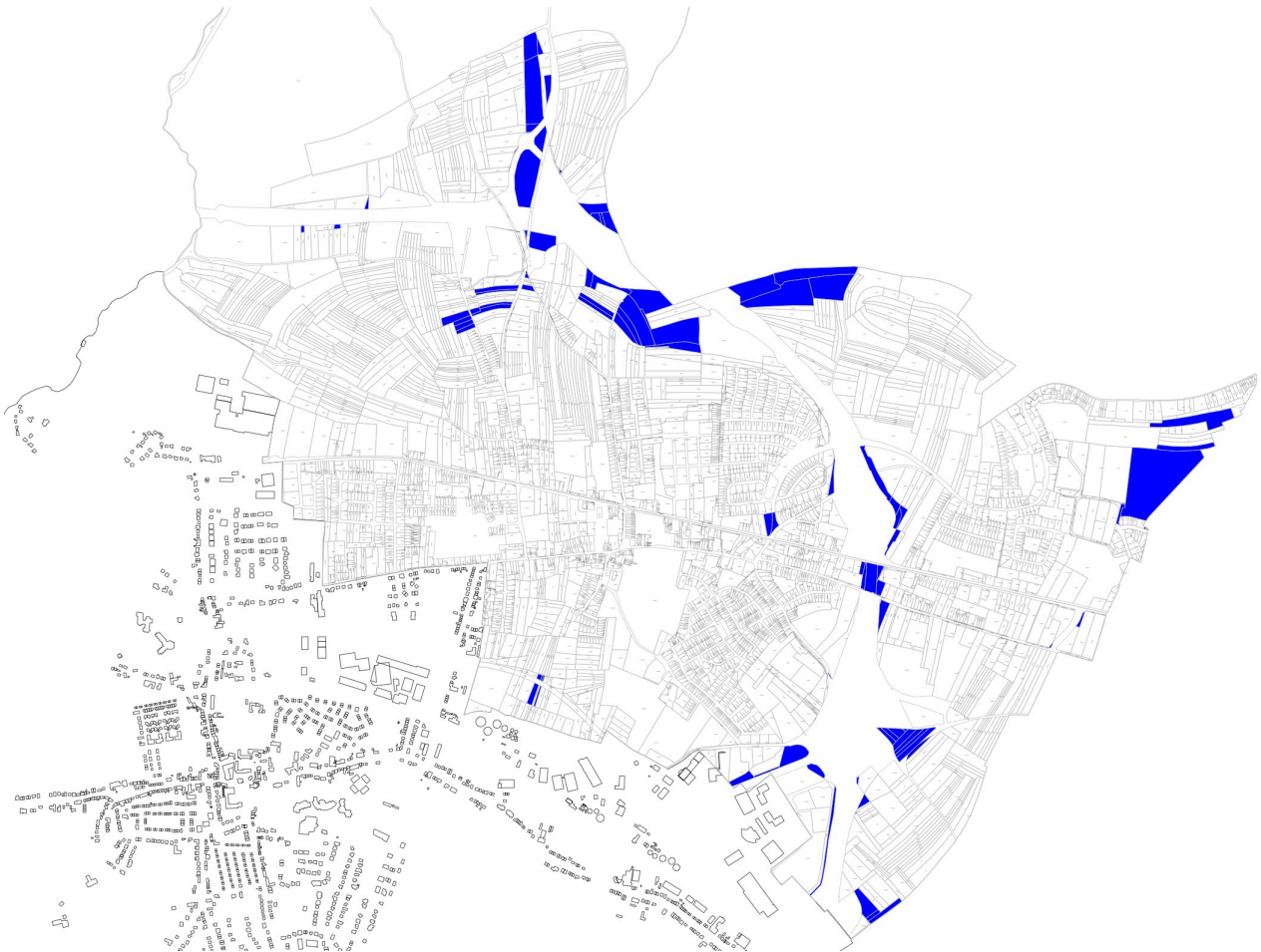
Abb. I.4.1: Staat und öffentliche Einrichtungen